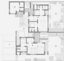
평면 © STAY ARCHITECTS